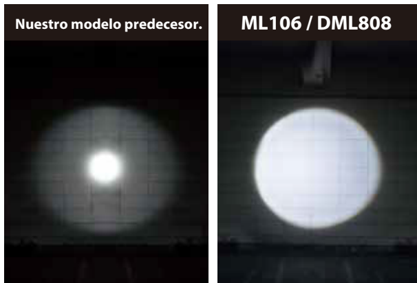
Nuestro modelo predecesor.