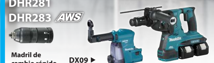
Madril de cambio rápido DX09 ▶

Makita Latin America, Inc. www.makitalatinamerica.com